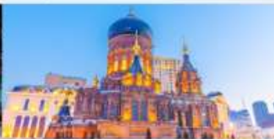
โบสถ์เซนต์ไอแซค