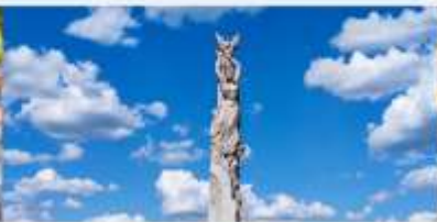
สวนประติมากรรมโลกฉางชุน