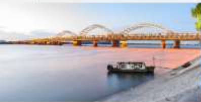
สะพานชางฮวาเจียง